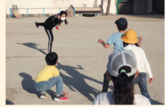
「楽しくドッチビー」

たくさんの学生が生き生きと活動をしています。地元の小学校で地域の方々と出会うことができたり、これからの目標が明確になったりしたという声が聞かれます。