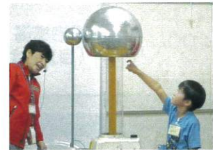
「サイエンスショー」