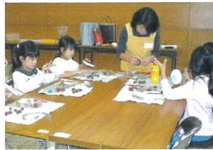
「ネイチャークラフト」