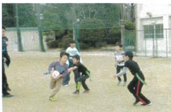
「タグラグビー教室」