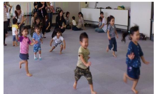
※他施設での運動風景です