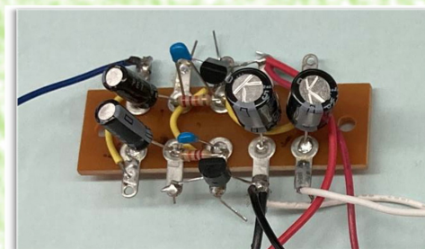
【部品をはんだづけしたラグ板】