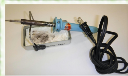
【はんだごてとこて台】

部品をつなぎ合わせるためには「はんだ」という合金（すずと鉛を混ぜたもの）を使います。はんだごてで、はんだを接着します。