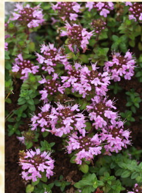
【イブキジャコウソウ】