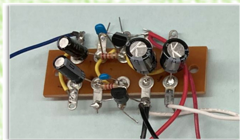
【部品をはんだづけしたラグ板】