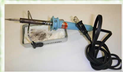
【はんだごてとこて台】

部品をつなぎ合わせるためには「はんだ」という合金（すすと鉛を混ぜたもの）を使います。はんだごてで、はんだを接着します。