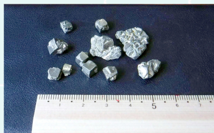
セリサイトと一緒にとれる黄鉄鉱