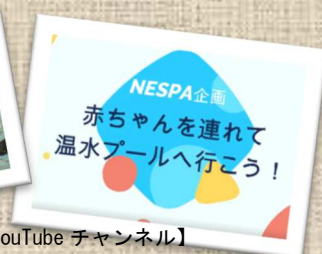
【NESPA YouTube チャンネル】