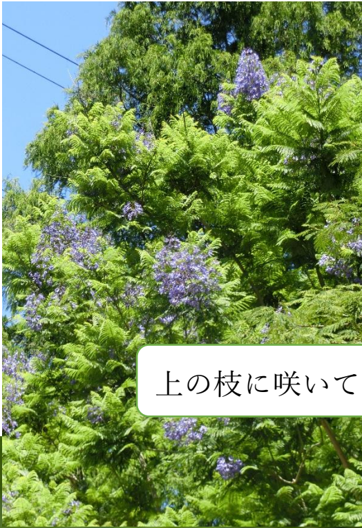
上の枝に咲いている

南半球の桜ともいわれるジャガランタの花。市内の農業文化園・戸田川緑地で見られます。(最寄りのバス停は南陽支所)