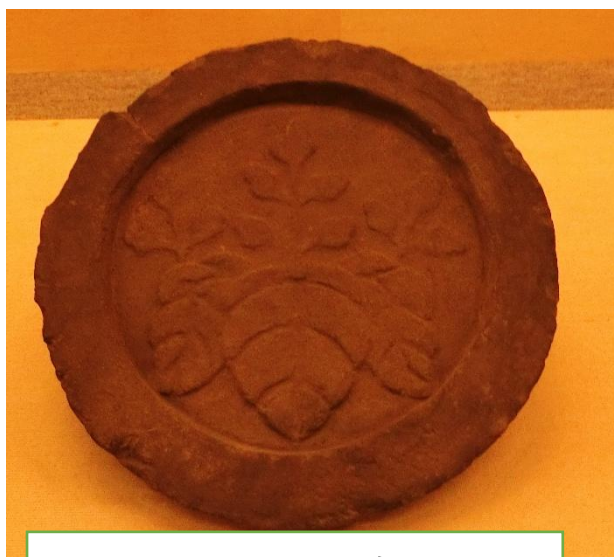
方広寺 桐紋軒丸瓦