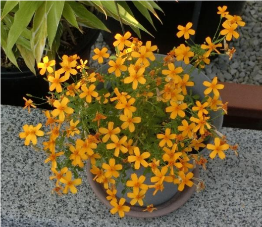
タゲテス・レモニー ‘ゴールドメダル’