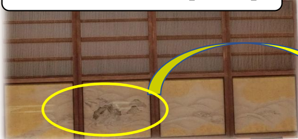
二之間障子腰貼付絵「岩浪図」