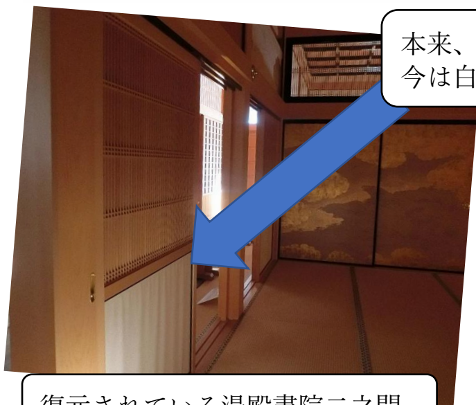
復元されている湯殿書院二之間

復元されている湯殿書院では、「岩波禽鳥図」の描かれた襖は左の写真の手前の位置です。今は襖が外されています。