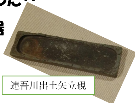
連吾川出土矢立硯

関係文書や当時の武器に加えて、長篠合戦の矢尻や火縄銃の弾丸、硯などが展示されています。長篠を思い浮かべながら観覧すると楽しさ倍増です。