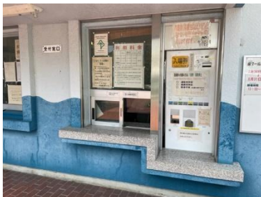
受付カウンター高さ81cm