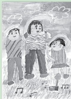
間瀬 絢香 1年生 「ラジオたいそう」