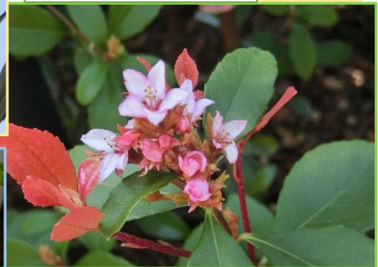
ベニバナシャリンバイ