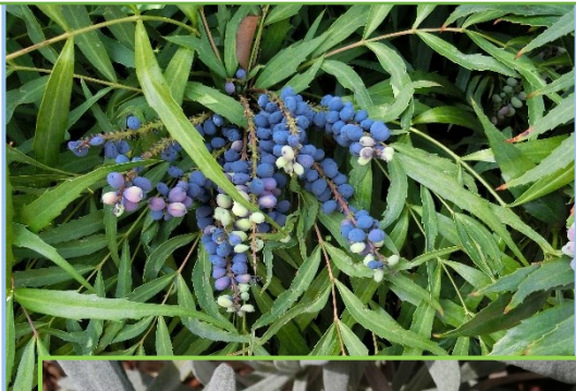
ホソバヒイラギナンテン