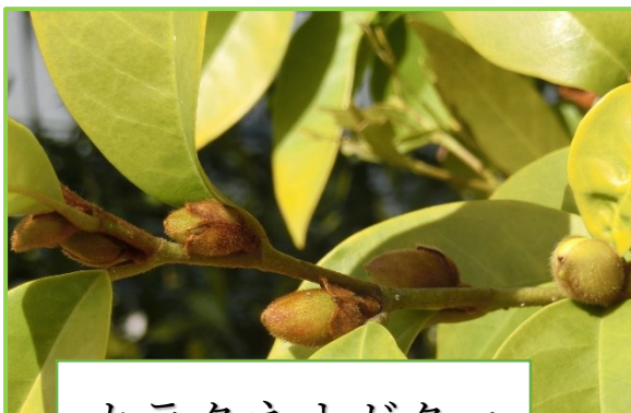
カラタネオガタマ