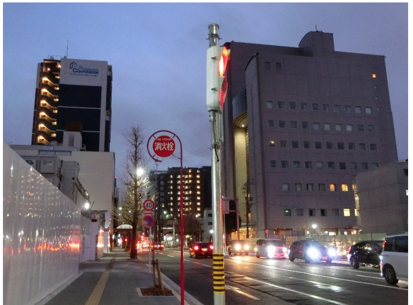
↑外堀通を背にして本町通を南へ