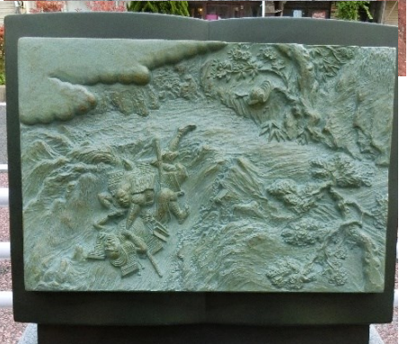
㉔ 加藤清正が賤ヶ岳の七本槍に数えられる