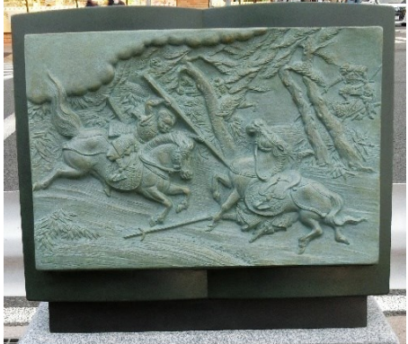
㉓ 賤ヶ岳の戦いで福島正則が功名をあげる。