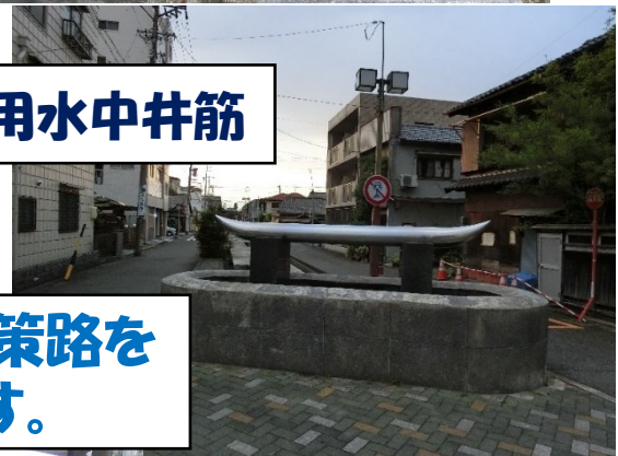
庄内用水の散策路を横切ると㉕です。