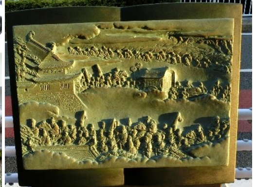
㉗ 京に聚楽第を建て後陽成天皇が行幸